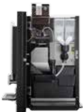
OPTIBEAN 3 (XL) TOUCH