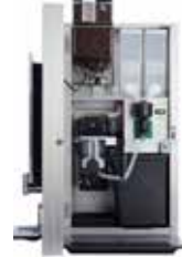
OPTIBEAN 3 (XL)