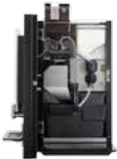
OPTIBEAN 2 (XL) TOUCH