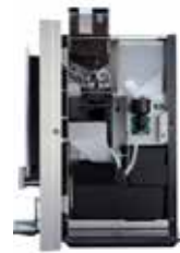
OPTIBEAN 2 (XL)